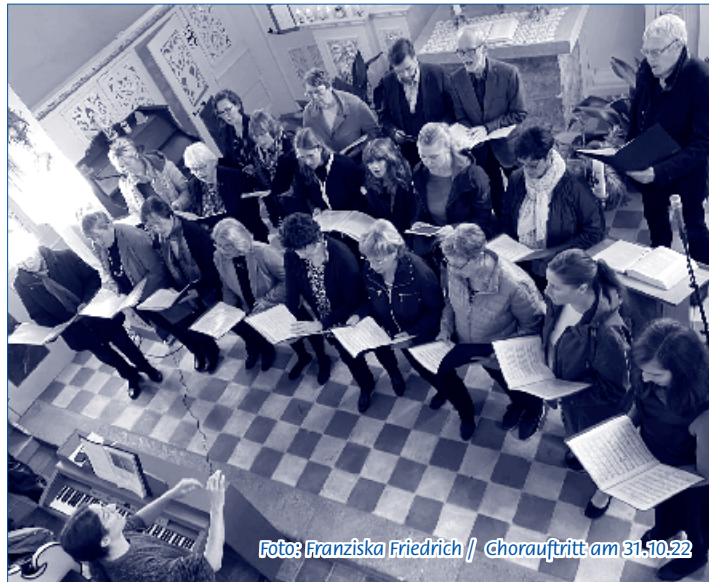
Chorauftritt am 31.10.22

gute Laune. Besonders schön ist es, andere erfreuen zu können, ob nun zu Feiertagen, Geburtstagen, Jubiläen, Konzerten oder bei Besuchen im Heim oder im Krankenhaus.“ Durch solche Informationen, durch „Mund-zu-Mund-Propaganda“, durch Auftritte zum Vereinstag, zur Kirmes, zu Erntedank oder zu anderen Gelegenheiten bekamen Interessierte Lust bei uns mitzumachen. Wir freuen uns, dass unser Chor trotz Corona um sieben neue Mitglieder auf nun 35 aktive Sängerinnen und Sänger angewachsen ist. Aber natürlich würden wir uns auch über neue weitere Mitglieder freuen, besonders zur Verstärkung unserer sechs Männer im Tenor und Bass. Man kann auch gern einfach mal in eine unserer Proben „hineinschnuppern“. Wir treffen uns jeden Mittwoch 20 Uhr im Gemeindesaal in der Petristraße 1. Die nächste Gelegenheit, unseren Chor zu hören, wird unser Adventskonzert am Samstag, den 26. November 2022, 18:00 Uhr, in der Marbacher St. Gotthardt Kirche sein. Dazu sind Sie herzlich eingeladen!