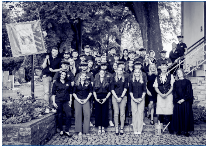
Eure Burschen des Marbacher Burschenvereins

In diesem Sinne wünschen wir allen Marbachern nur das Beste und hoffen auf ein schönes Kirmesfest mit euch zusammen, auch wenn es in diesem Jahr etwas anders sein wird.